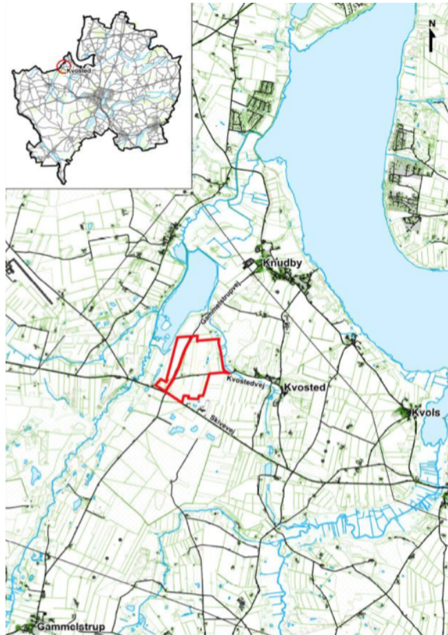
Placering af solcellepark

European Energy påtænker at opføre en solcellepark ved Kvosted. Anlægget har en effekt på 50 MW og en forventet årlig elproduktion på 107 mio. kWh. Til sammenligning kan det oplyses, at Elnet Midts årlige transport er på ca. 170 mio. kWh.